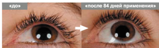
№16 CAPOL, возраст 25 лет, пол женский