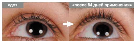
№29 LAF CY, возраст 19 лет, пол женский