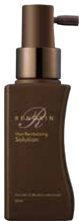
РЕНОКИН восстанавливающий лосьон

Иновационная формула, обогащенная биомиметическими пептидами, стимулирует рост волос и способствует сохранению волосяных фолликулов. Активные ингредиенты делают волосы пышными, густыми и блестящими.