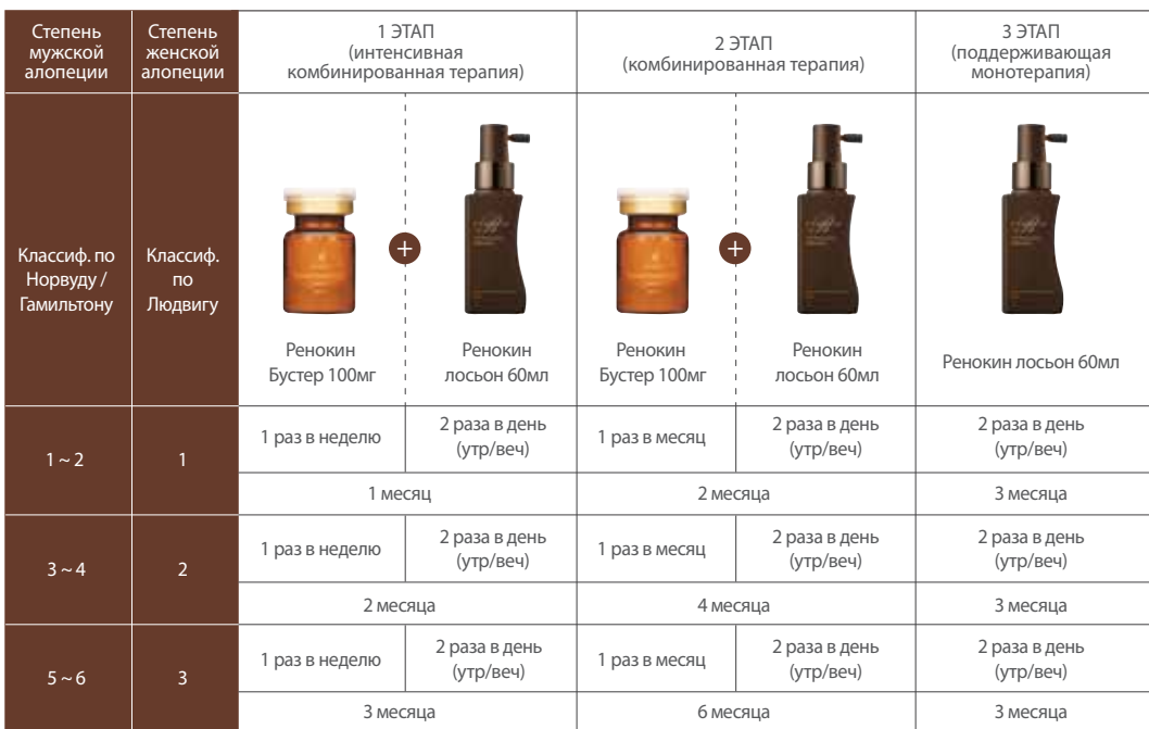
Схема терапии, в соответствии с классификацией алопеции:

Необходимо последовательное комплексное применение схемы RENOKIN для достижения ожидаемого эффекта.