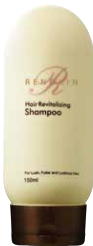
РЕНОКИН восстанавливающий шампунь

Иновационная формула, обогащенная биомиметическими пептидами, стимулирует рост волос и способствует сохранению волосяных фолликулов. Активные ингредиенты делают волосы пышными, густыми и блестящими.