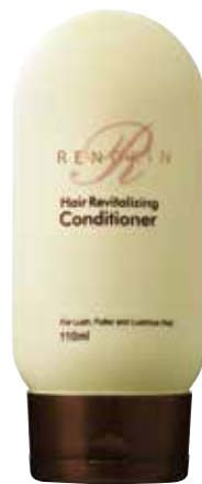
РЕНОКИН восстанавливающий кондиционер

Оптимизирует возможности кожи волосистой части головы и волос абсорбировать активные ингредиенты полностью.